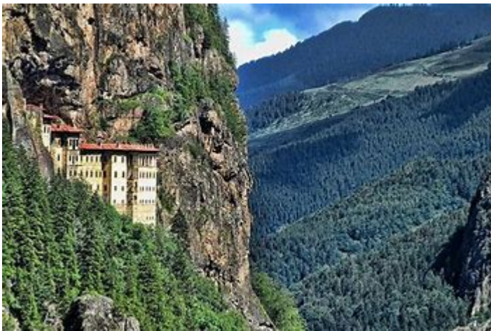
(Monastero di Sumela -Turchia)

Il seminario di geografia si svolgerà di lunedì' (2 -16 dicembre), alle 20,30, presso Villa Farina.